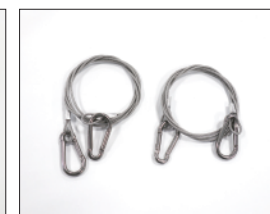
付属:落下防止ワイヤー